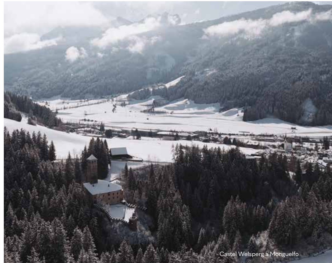
Castel Welsperg a Monguelfo